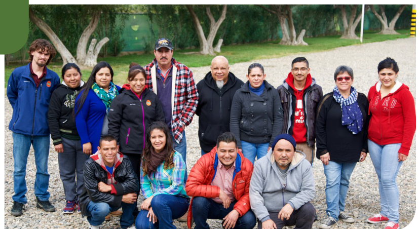
FOTO: Equipo de liderazgo de Alpine Fresh, Inc. en Tecate, México